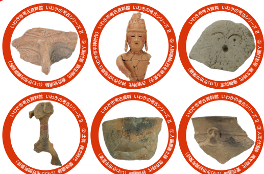
いわきの考古 缶バッジ (全6種類)

参加者には「考古ガチャ」で、 「いわきの考古 缶バッジ」 からひとつを差し上げます!