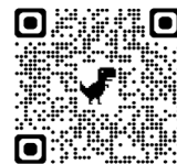
申込 QR コード

参加者には「考古ガチャ」で、 「いわきの考古 缶バッジ」 からひとつを差し上げます!