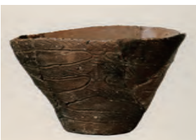
龍門寺遺跡から出土した弥生時代中頃の土器は龍門寺式土器と呼ばれ、年代の指標となっている。

本展ではいにしえのいわき地方に生きた弥生人がつくった土器の造形と特徴を紹介します。