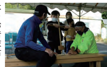
火おこし体験の様子