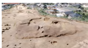
平窪諸荷遺跡から検出された古墓。丘陵上に方形の周溝がめぐる新しい形の墓です。

本展では市内各地から出土した様々な道具類をもとに、いわき地方に生きた弥生人の生活を紹介します。