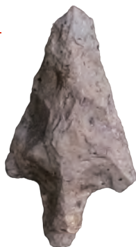
石鏃 流紋岩製 砂畑遺跡

本展では、平城跡、北作B遺跡(勿来町)など令和7年度に実施した市内遺跡発掘調査成果を紹介します。