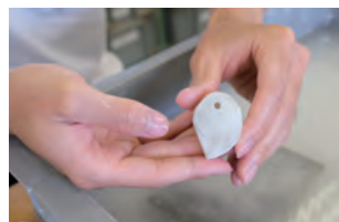
体験学習会の様子。まが玉づくり(上写真)と土器づくり(右写真)。