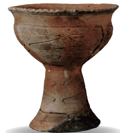
龍門寺式土器(高杯) 龍門寺遺跡(いわき市平上荒川)出土