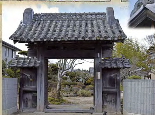
吉田家門(いわき市指定有形文化財 建造物) ※泉館の門か