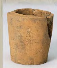
焼塩壺(泉城跡出土)