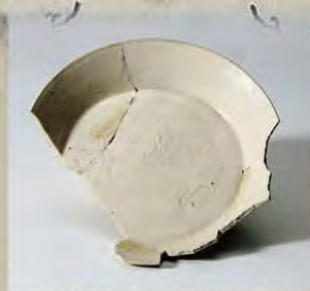
白磁雲龍文皿(泉城跡出土)